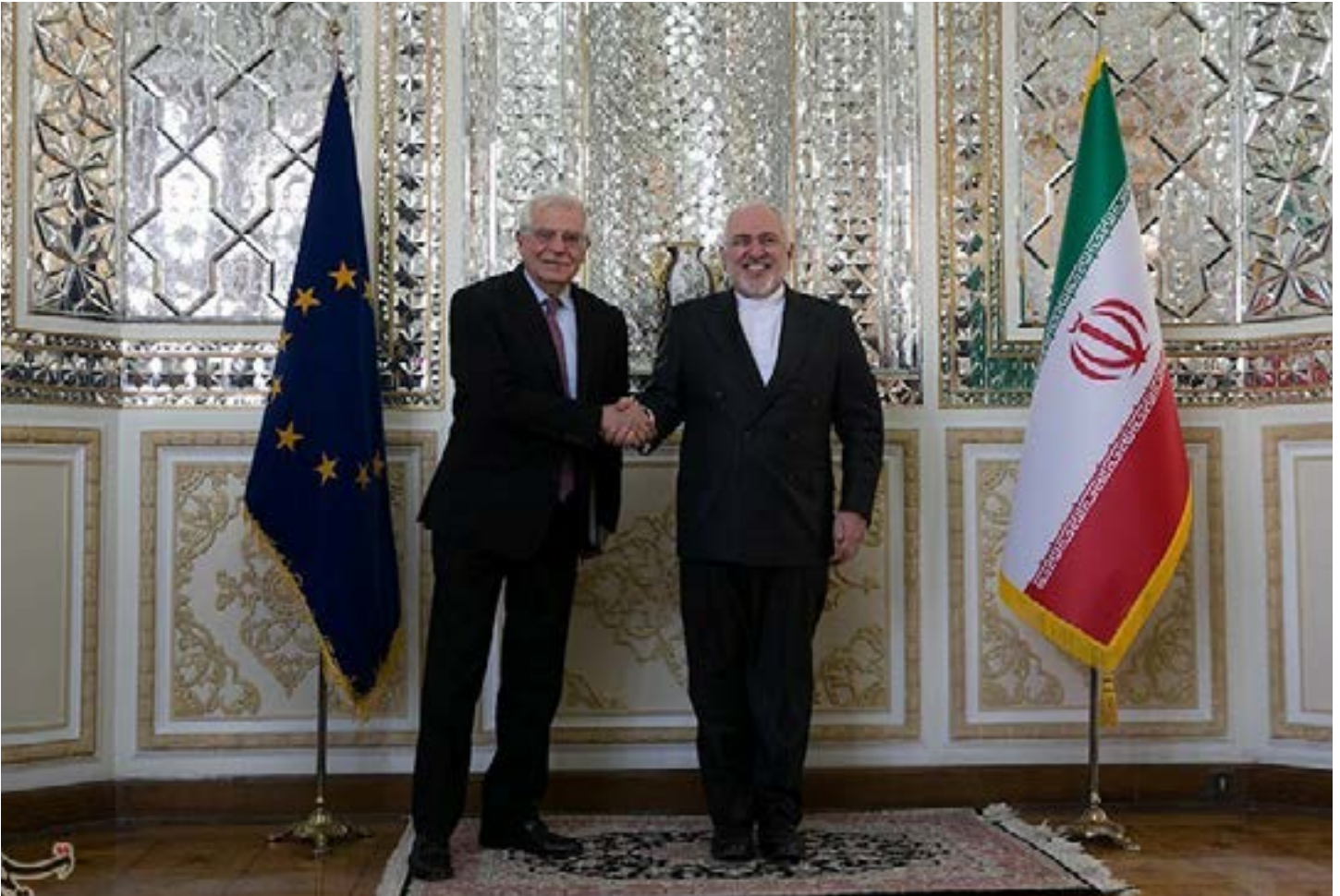
Iranian Foreign Minister Javad Zarif shakes hands with High Representative of the EU for Foreign Affairs and Security Policy and Vice-President of European Commission Josep Borrell in Tehran, Iran, February 3, 2020.

هنگامی که آمریکا به طور یک جانبه برجام را ترک کرد، راه گفت و گوی مستقیم با ایران از طریق کمیسیون مشترک این توافق، که ریاست آن را نماینده عالی اتحادیه اروپا در سیاست خارجی بر عهده دارد، از دست داد. بریتانیا، فرانسه و آلمان- گروه موسوم به E۳ - کرسی های کمیسیون و همچنین پیوندهای دیپلماتیک با ایران را حفظ کردند و با وجود گام هائی که دولت ترامپ برداشت و اقدام های متقابل ایران، به دنبال حفظ برجام بودند. با برگزاری انتخابات آمریکا، اکنون سه کشور اروپایی E۳ در موقعیتی قرار دارند که همراه با اتحادیه اروپا، بار دیگر خلاء حاضر را پر کنند. تاریخ نشان داده که هر گاه آمریکا و اروپا سیاستشان را در مورد ایران هماهنگ کرده اند، پیشرفت واقعی قابل دسترس تر بوده است.